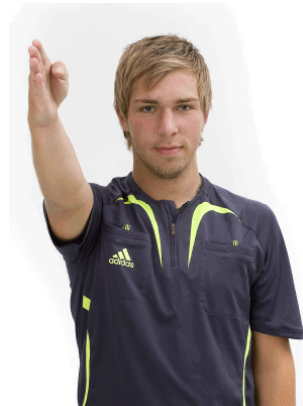
Frikast - riktning