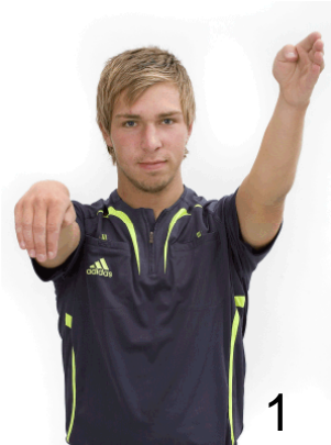
Beträdande av målgården