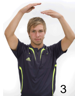
För många steg eller bollen hålls mer än 3 sek.