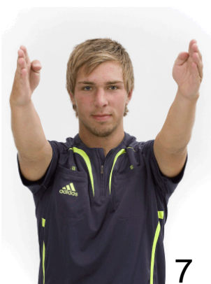
Inkast - riktning