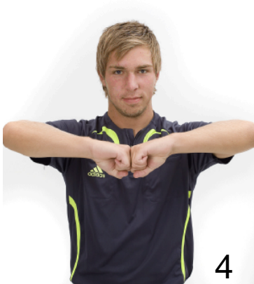
Omklamring, fasthållning eller knuff