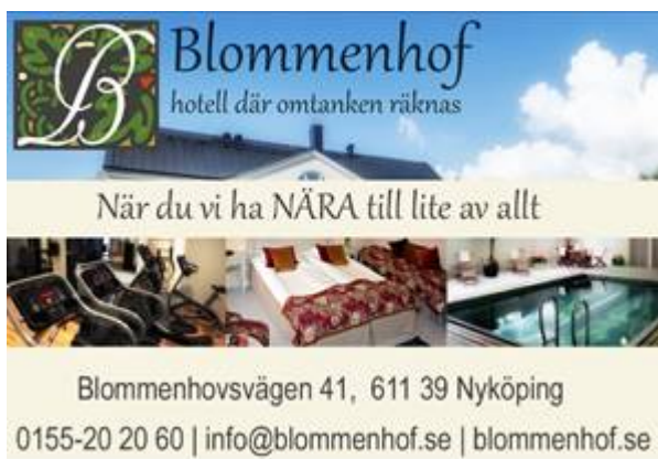
Blommenhof (Nöthagen, ca 4km t Rosvalla) 0155-20 20 60