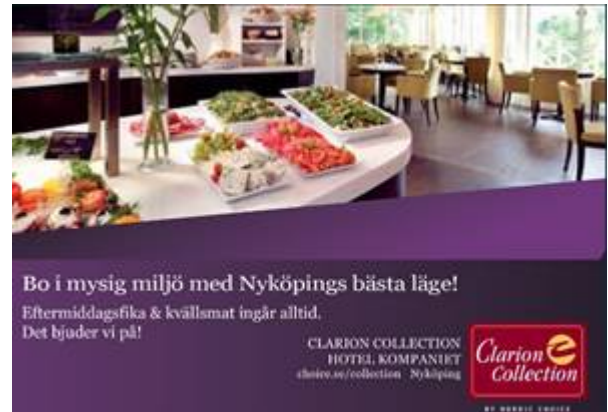
Clarion Collection Hotellkompaniet (hamnen, ca 1,5km t Rosvalla) 0155-28 80 20