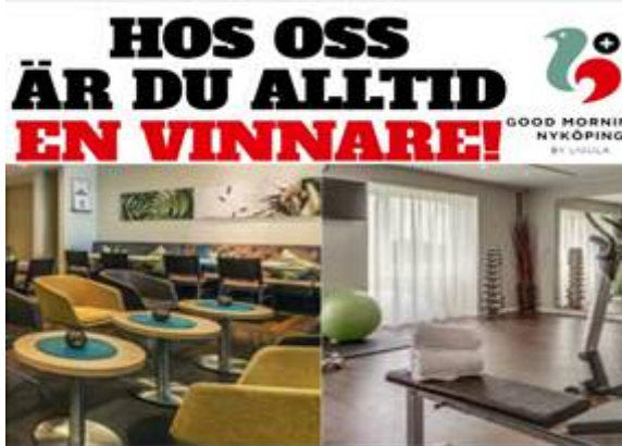
Good Morning Hotel (södra infarten, ca 3,5km till Rosvalla) 0155-28 90 00