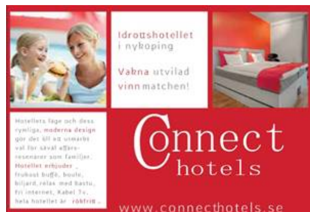
Connect Hotel (Skavsta flygplats, ca 9,5km t Rosvalla) 0155-20 02 20